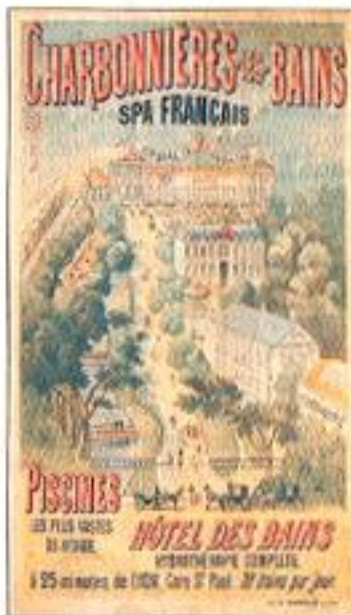
Les curistes venaient en nombre

> NOTE Maison d'Expositions de l'Araire, 23 rue de la Cascade, Yzeron. Ouvert les samedis, dimanches et jours fériés de 14 à 18 heures. Tél. 04 78 81 07 79 (uniquement